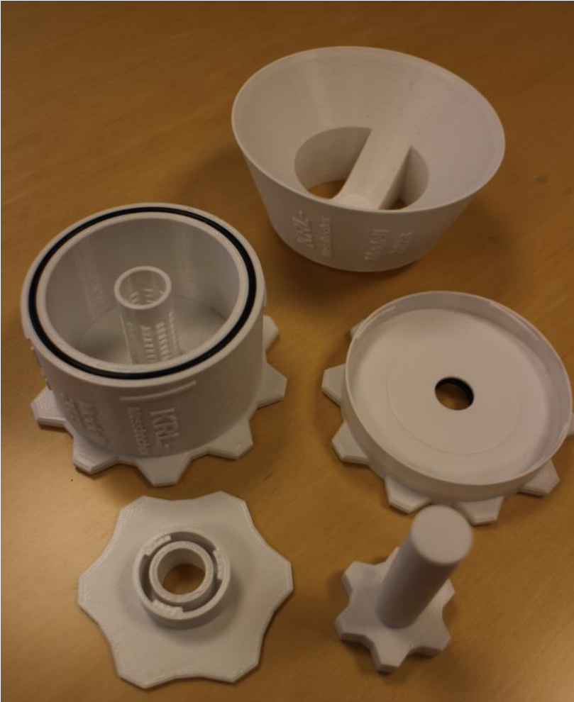
Die vier Einzelteile des Bechers, von oben: Trichter, Becher, Deckel, Sensorklemme, Sensoratrappe