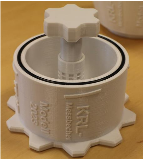
Becher mit Sensoratruppe