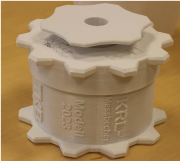
Einsatzbereiter Messbecher ohne Sensor