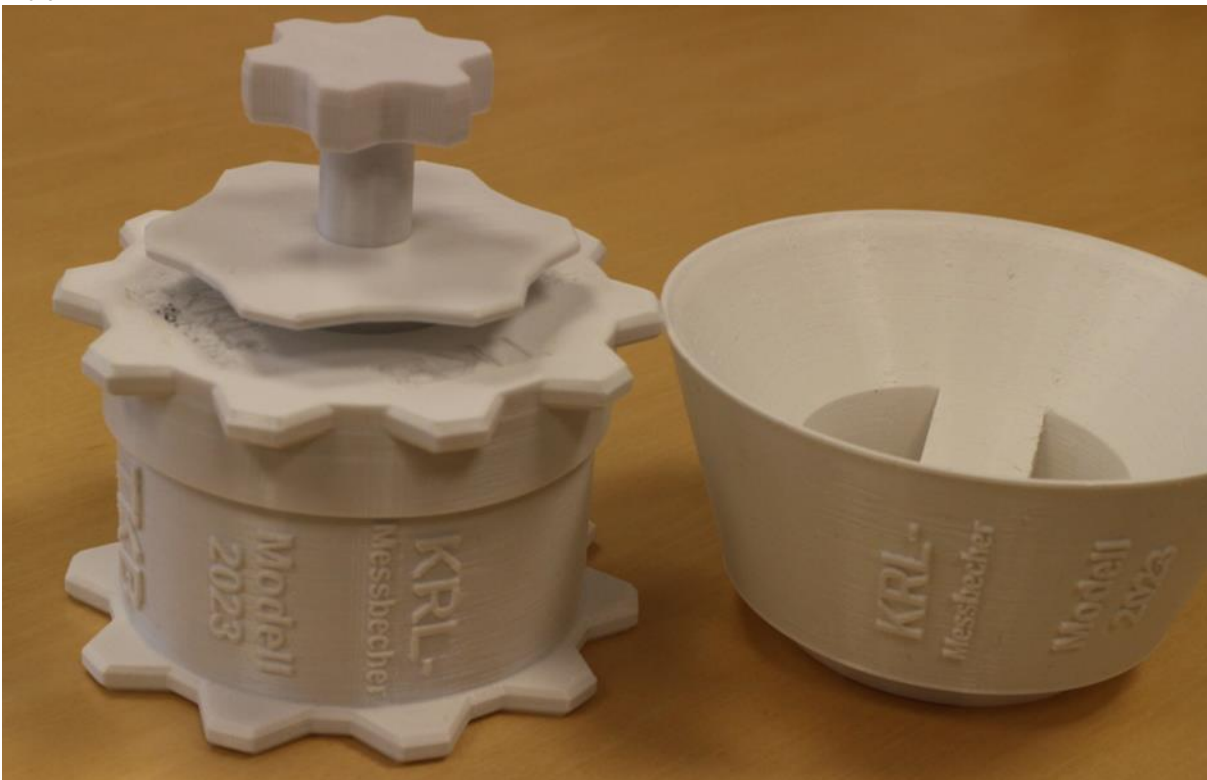
Alle Teile des Bechers zusammen.