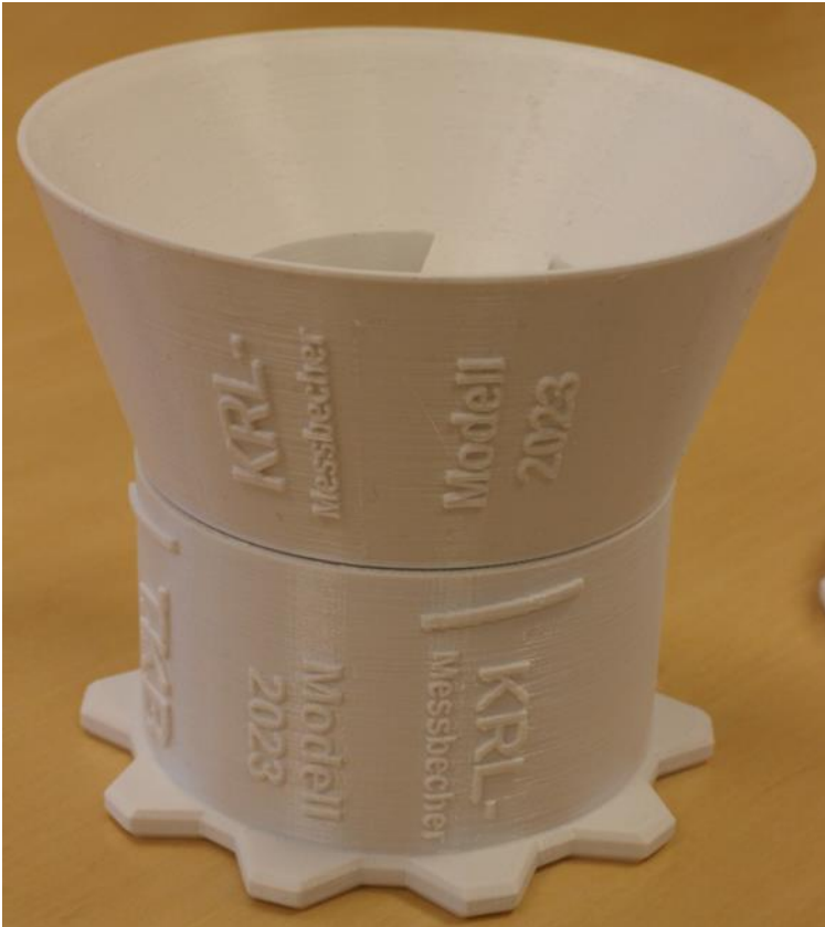
Becher mit aufgesetztem Trichter zum befüllen