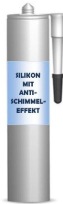
Abbildung 1: Behandelter Dichtstoff mit primärer Biozidfunktion

deklarierten bioziden Eigenschaften im Zusammenhang mit der Art des behandelten Klebstoffes/Spachtelmasse/Dichtstoffes sind in Kapitel 2 dieses Leitfadens genauer beschrieben.